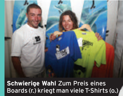
Schwierige Wahl Zum Preis eines Boards (r.) kriegt man viele T-Shirts (o.)