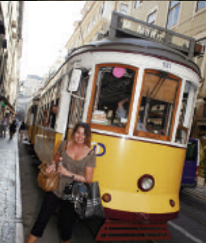
Günstige Rundfahrt Mit Linie 28, für 1.30 € quer durch die Stadt