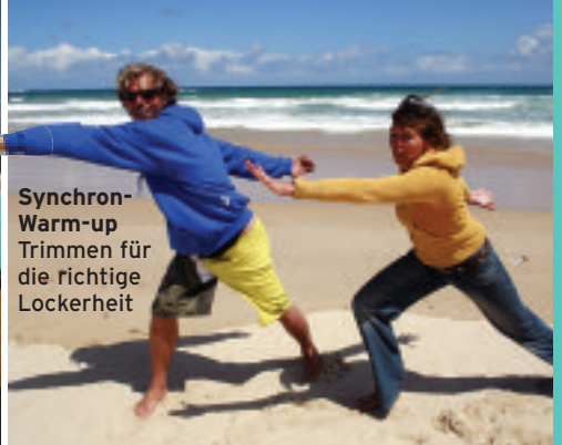
Synchron-Warm-up Trimmen für die richtige Lockerheit