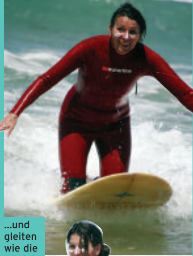
...und gleiten wie die Königin der Wellen!