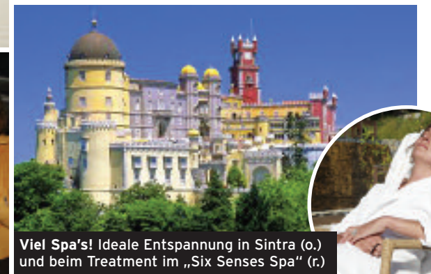
Viel Spa's! Ideale Entspannung in Sintra (o.) und beim Treatment im „Six Senses Spa“ (r.)