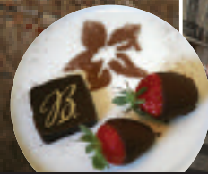
Süße Zugabe Das Hotel „Bairro Alto“ im gleichnamigen Viertel serviert Schokofrüchte gratis zum Kaffee