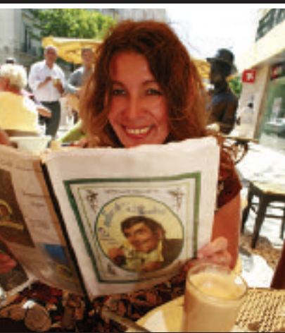
Litera-Tour Das „A Brasileira“, Café der Dichter & Reisereporter

» hier und dort auch schon mal zu den „Tubes“, den Wellenröhren aufbauen. Beim Surfen im Tunnel sollten Anfänger jedoch eher zuschauen. Wir paddeln auf der Suche nach der perfekten Welle. Wenn sie kommt, legen wir Tempo zu, schwingen uns auf sie, klappt wirklich schon ganz gut. Nachmittags erkunde ich das grüne Hinterland. Sintra ist beeindruckend. Gerade mal 40 Kilometer entfernt, lande ich in einer vollkommen anderen Welt. Statt umtosten Küsten locken hier tiefgrüne Wälder, felsig-schroffe Hügel, verfallene Burgen – eine Landschaft wie bei den Gebrüdern Grimm. Ähnlich märchenhaft: das „Six Senses Spa“ im idyllisch gelegenen „Ritz Carlton Penha Longa“, in dem ich mir eine zweistündige „The Cloisters“-Behandlung, mit Limonen-Körperpackung und anschließender Verbena-Massage, gönne (2,5 Std, 215 €). Nach dem Treatment bin ich wie neugeboren und zu neuen Abenteuern bereit.