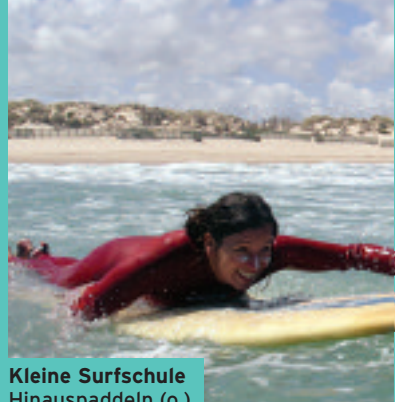
Kleine Surfschule Hinauspaddeln (o.), wenden, perfekte Welle abwarten...