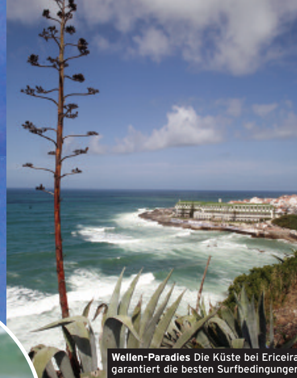
Wellen-Paradies Die Küste bei Ericeira garantiert die besten Surfbedingungen