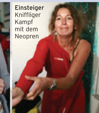
Einsteiger Kniffliger Kampf mit dem Neopren

TEXT & PRODUKTION CUTINA W. ENGLER