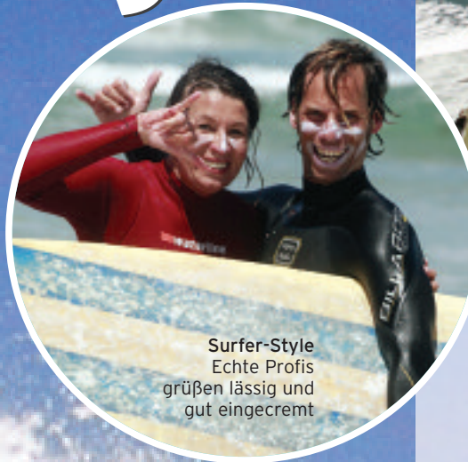
Surfer-Style Echte Profis grüßen lässig und gut eingecremt