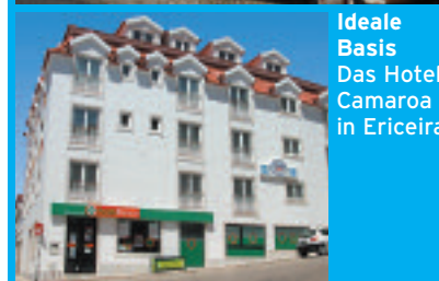
Ideale Basis Das Hotel Camarao in Ericeira